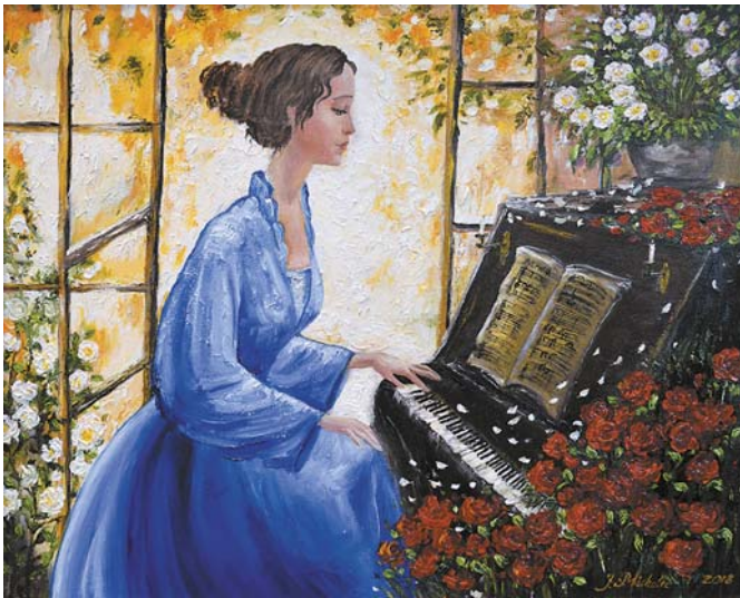
Jolanta Michalec, „Anna Maria”, 50 × 40 cm, olej, płótno