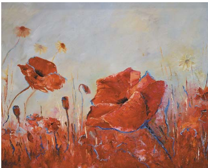
Katarzyna Kusal, „W słonecznym blasku”, 50 × 40 cm, olej, płótno