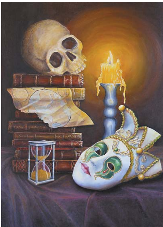
Danuta Skulicz, „Venitas”, 50 × 70 cm, olej, płótno