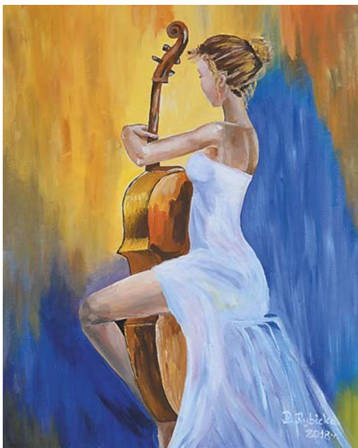
Bożena Rybicka, „Prześlizgnięta wiolonczelistka” 40 × 50 cm, akryl, płótno