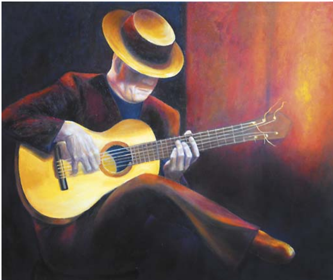
Ewa Wilk, „Światło muzyki”, 60 × 50 cm, olej, płótno