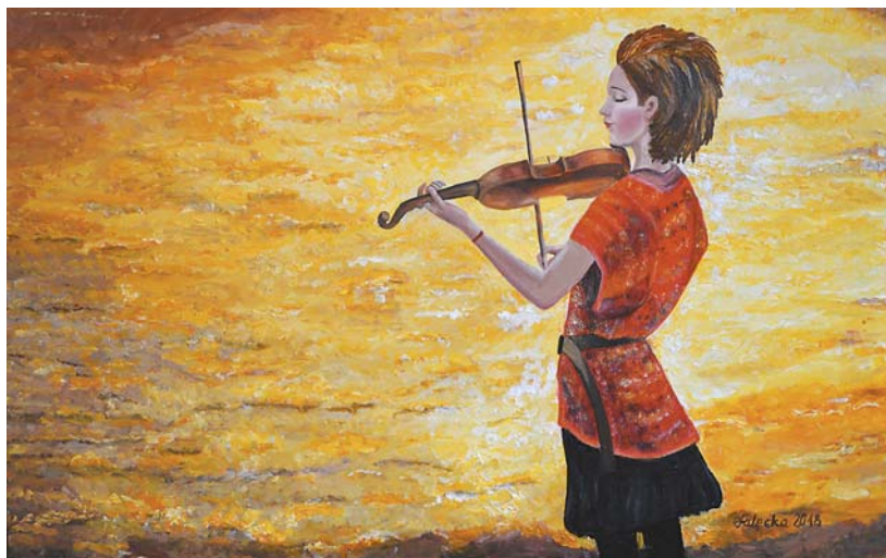
Ewa Fałęcka, „Muzyka słońca”, 80 × 50 cm, olej, płótno