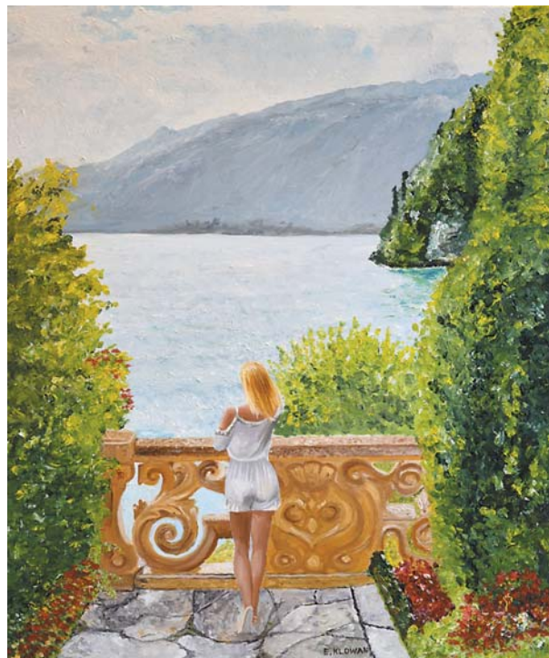
Elżbieta Klowan, „To miejsce”, 50 × 60 cm, olej, płótno