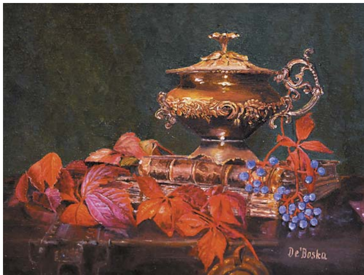
Krystyna Dębowska, „Kolory życia”, 36 × 27 cm, olej, płótno