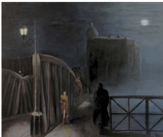
Katarzyna Rogala-Łach, „Tam ci będzie lepiej”, 60 × 50 cm, olej, płótno