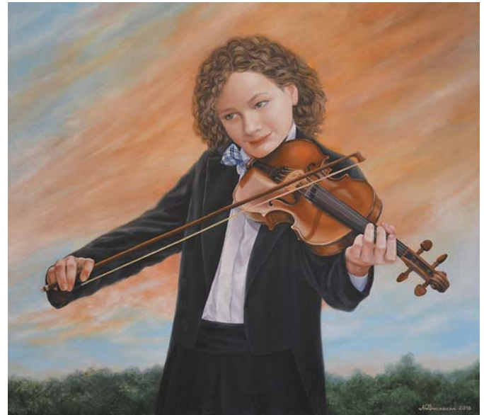
Natalia Buczacka, „Wibracje nieba”, 80 × 70 cm, olej, płótno