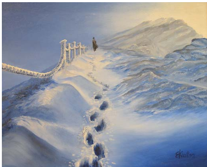
Elżbieta Kustra, „Zimową porą”, 50 × 40 cm, olej, płótno