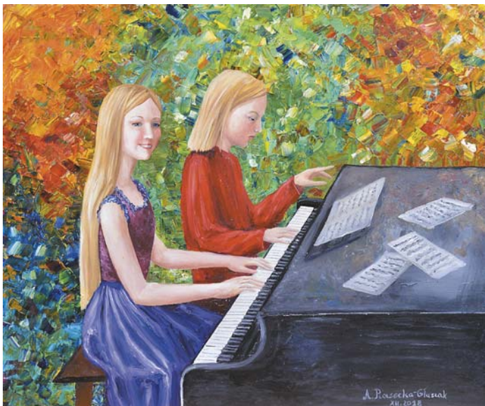
Agnieszka Piasecka-Głuszak, „Świąteczne muzykowanie” 50 × 60 cm, olej, płótno