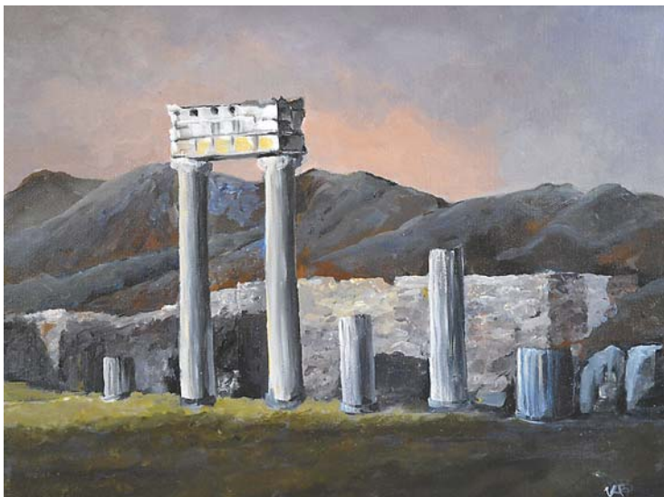
Violetta Brandszteter-El Zein, „Ruiny”, 40 × 30 cm, akryl, płótno