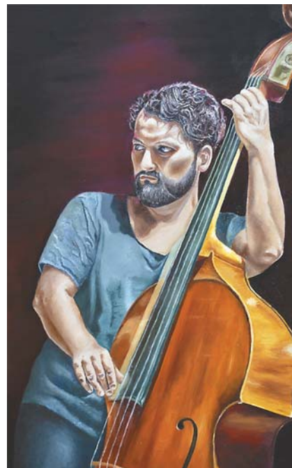
Edyta Zaradzka, „Kontrabasista” 50 × 80 cm, olej, płótno