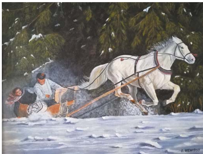
Elżbieta Wiewiórko, „Kulig”, 50 × 40 cm, olej, płótno