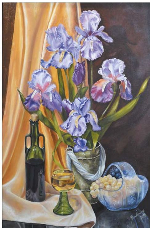
Mariola Donderowicz, „Irysy”, 60 × 90 cm, olej, płótno