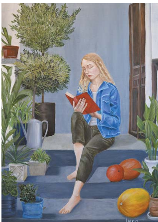
Ignacy Prokopiuk, „Dziewczyna w niebieskiej bluzie” 50 × 70 cm, akryl, olej, płótno