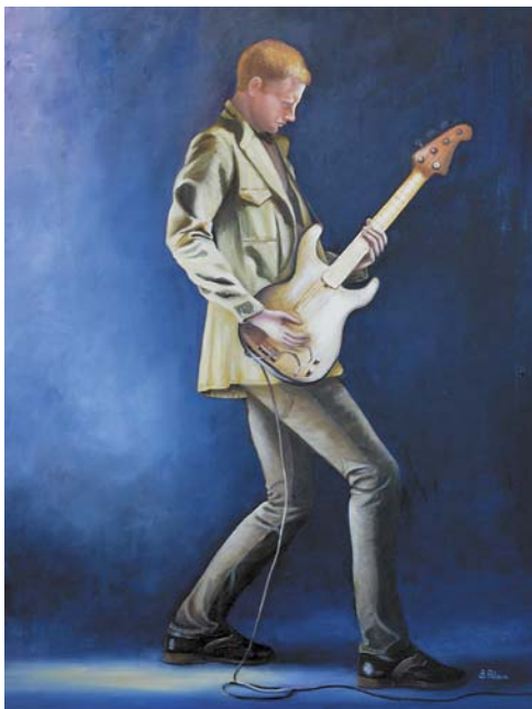
Bożena Wlazło „Żywił Piotra” 60 × 80 cm olej, płótno