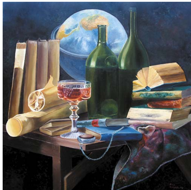
Ewa Wilhelmi „W pamięci czasu” 70 × 70 cm olej, płótno