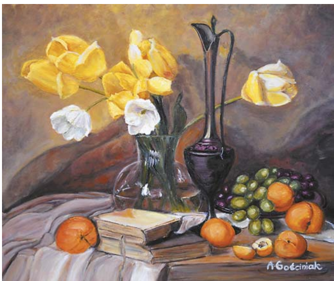
Anna Gościński, „Tulipany”, 60 × 50 cm, olej, płótno