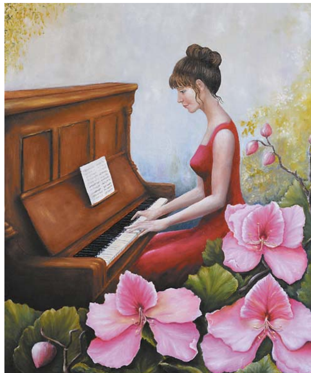
Aldona Pawłowska, „W ogrodzie”, 50 × 60 cm, olej, płótno