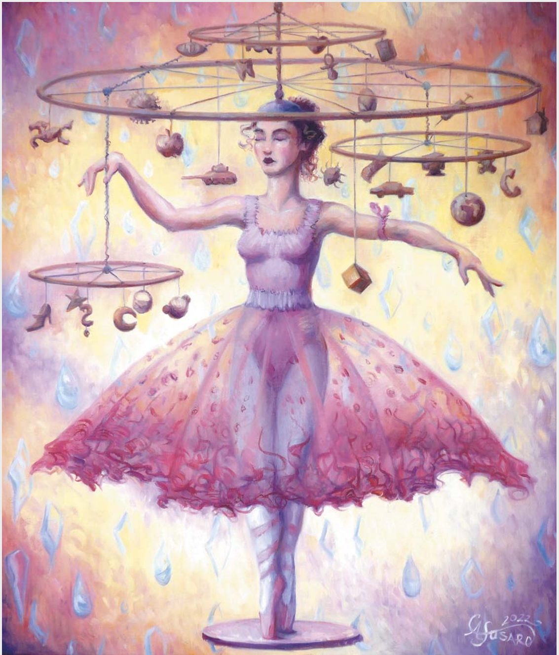
Niewolnica myśli , olej na płótnie, 60 × 70 cm