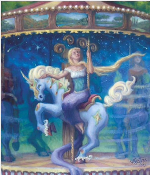
Karuzela życia, olej na płótnie, 60 × 70 cm