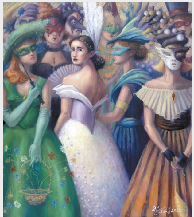
Maskarada, olej na płótnie, 70 × 80 cm