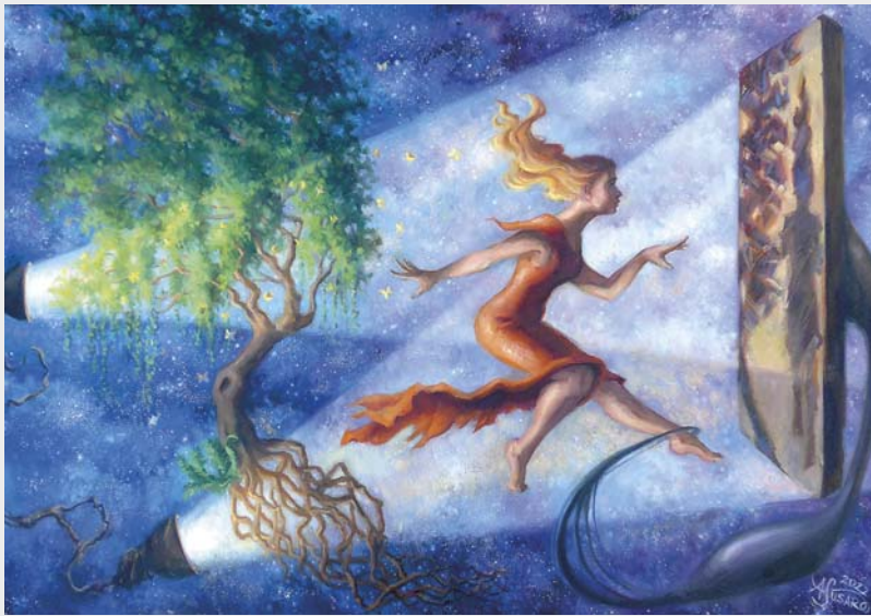
Projekcja platońska, olej na płótnie, 100 × 70 cm