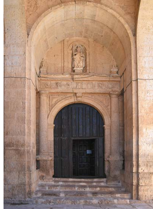
Villasilos: Portal kościoła św. Andrzeja