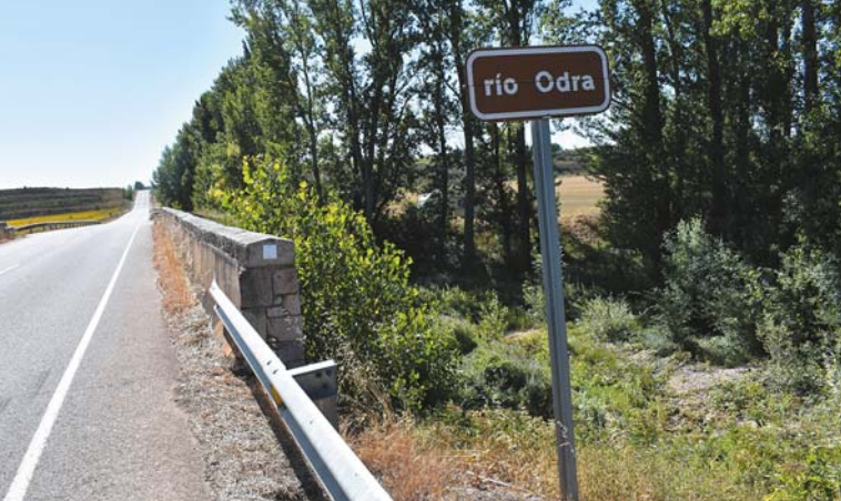
Most na Odrze obok Sandoval de la Reina