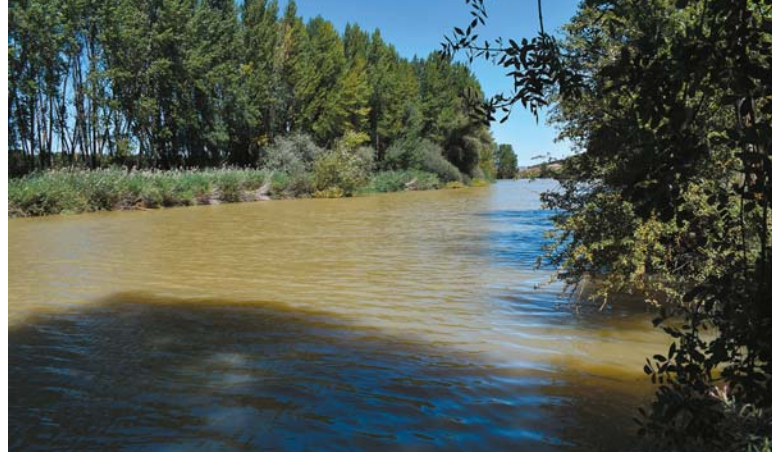
Rzeka Pisuerga, do której wpływa Odra