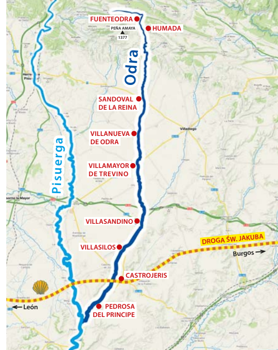
↑ Rio Odra na mapie Hiszpanii ↓ Villanueva de Odra: Rzeka Odra, w dali kościół św. Piotra i Pawła