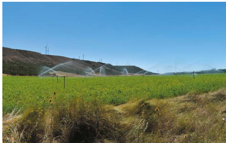
Pola uprawne w okolicach Pedrosa del Príncipe nawadniane wodą z Odry