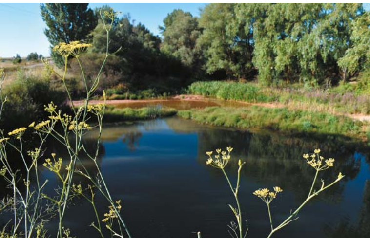
Rzeka nieopodal Villanueva de Odra