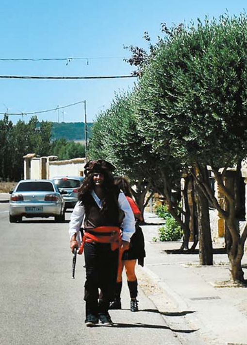
Piraci z Karaibów na ulicach Pedrosa del Príncipe