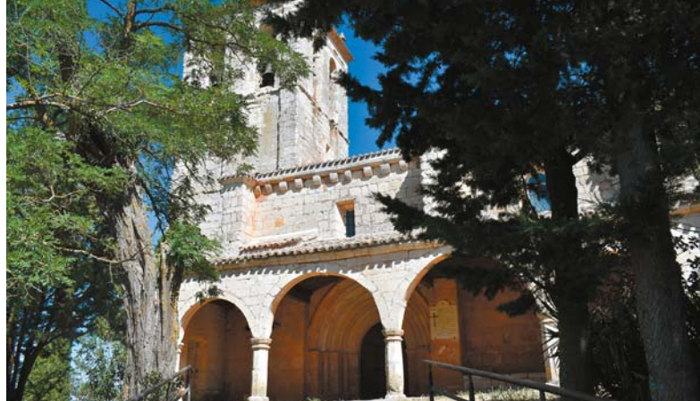
Sandoval de la Reina: Romański kościół św. Piotra