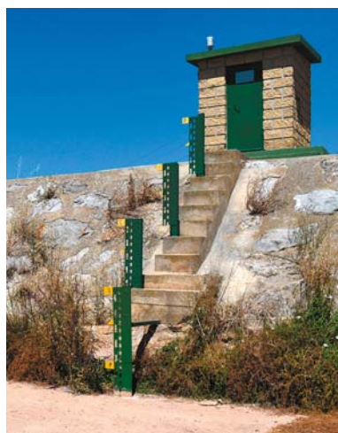
Wodowskaz na Odrze w Pedrosa del Príncipe