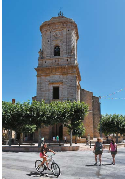
Villasilos: Kościół św. Andrzeja