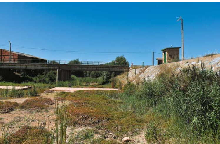
Odra na terenie Pedrosa del Príncipe