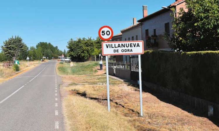
Nadodrznka miejscowości Villanueva de Odra