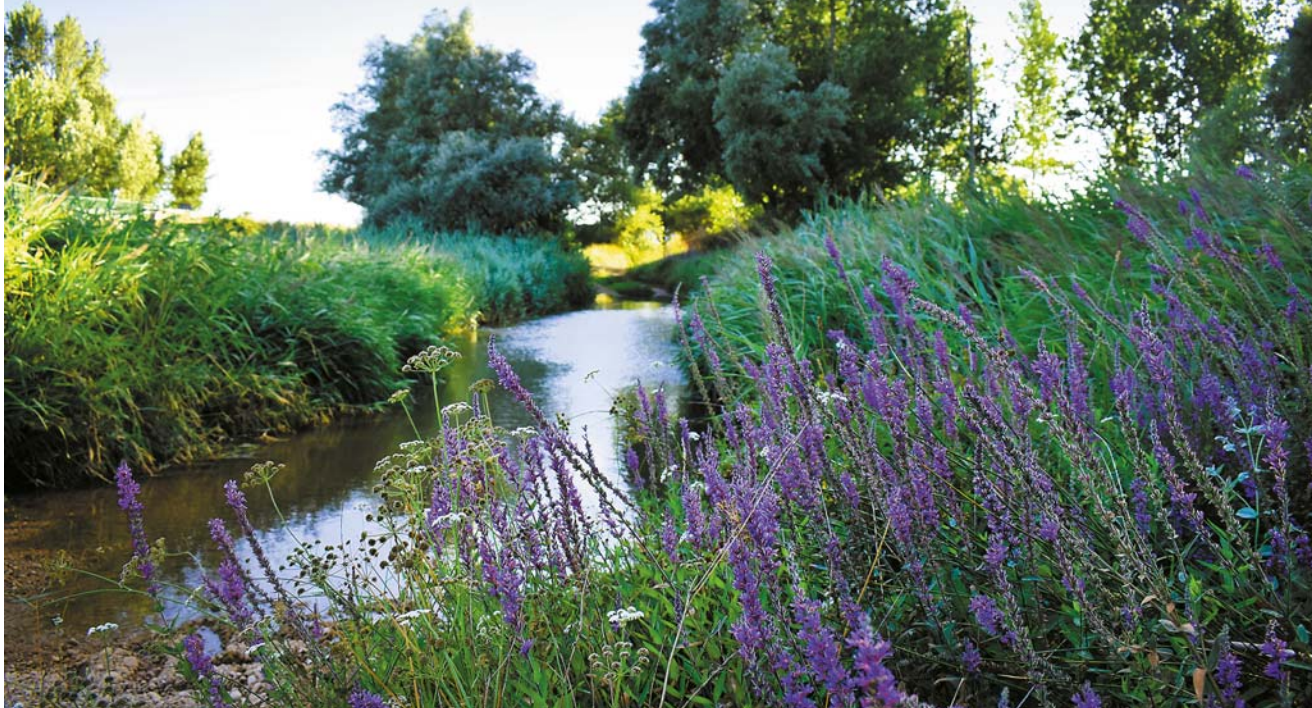
Okolice Villamayor de Treviño: Bród na Odrze