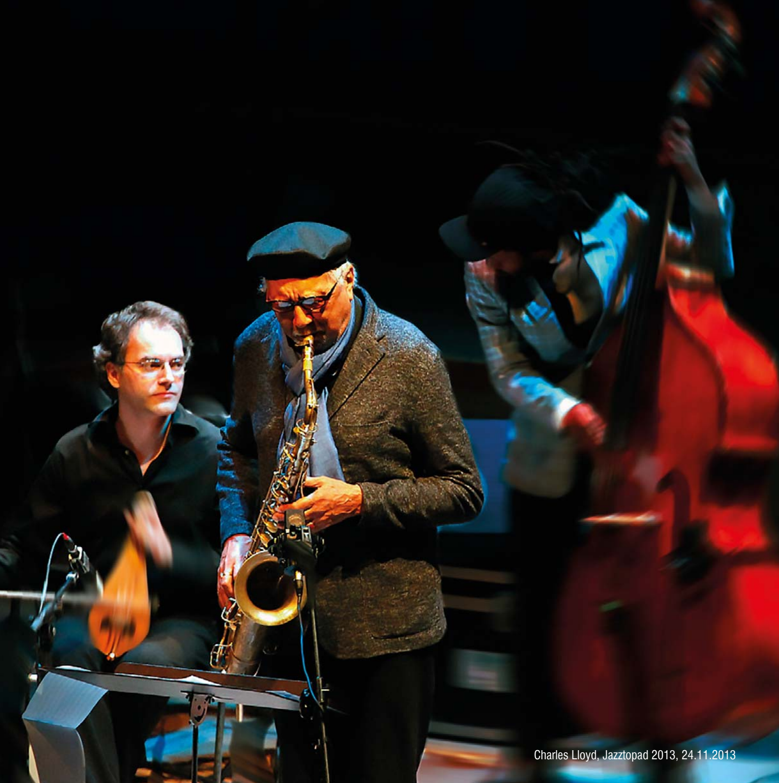
Charles Lloyd, Jazztopad 2013, 24.11.2013