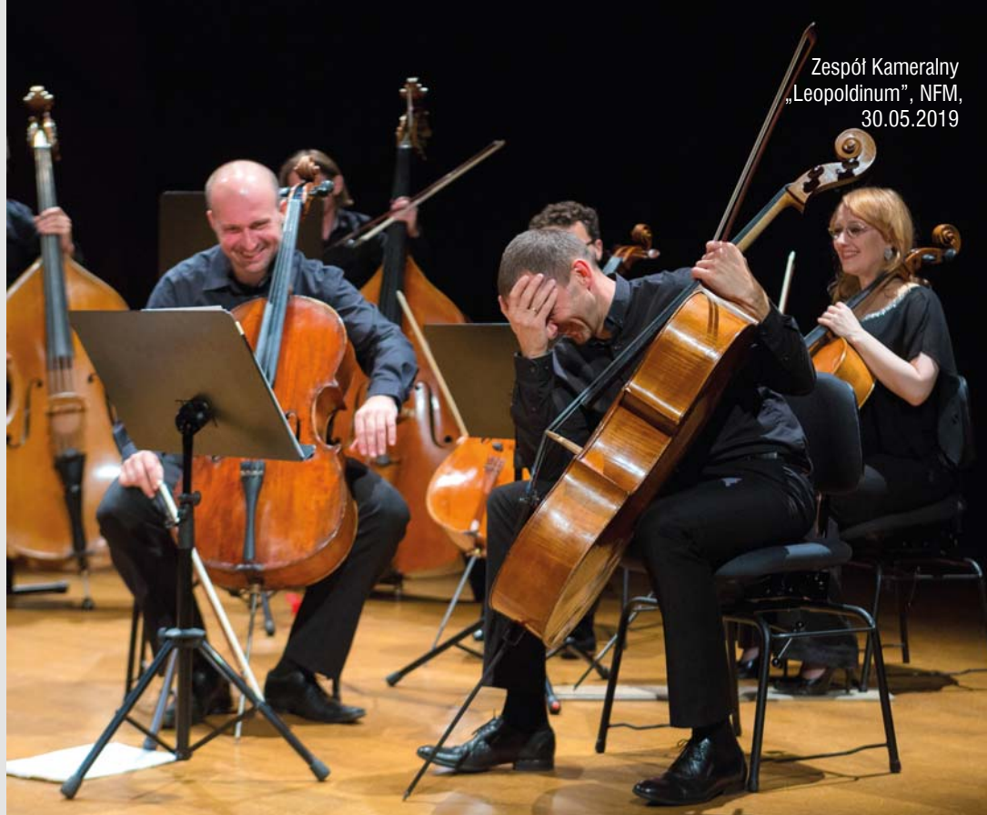
Zespół Kameralny „Leopoldinum”, NFM, 30.05.2019